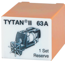
imagen del producto simbólico