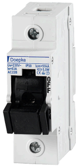
imagen del producto simbólico