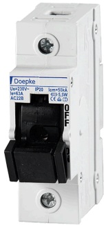
imagen del producto simbólica