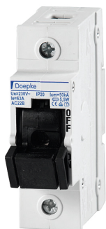
imagen del producto simbólico