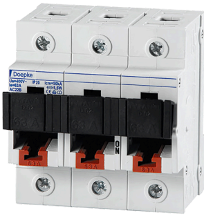
imagen del producto simbólica