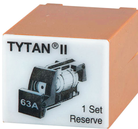
imagen del producto simbólico