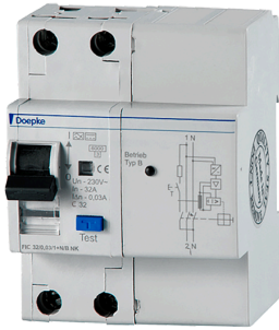
imagen del producto simbólica