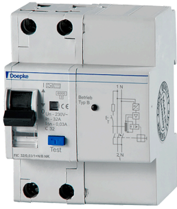
imagen del producto simbólica