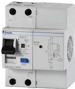
imagen del producto simbólico