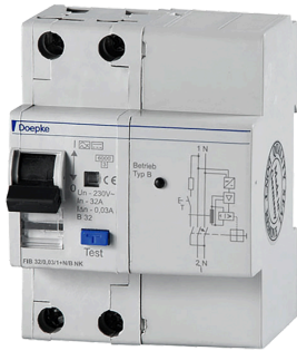
imagen del producto simbólico