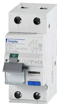
imagen del producto simbólico