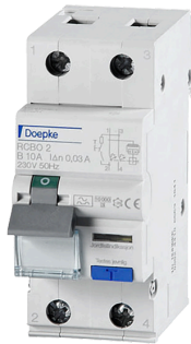
imagen del producto simbólica