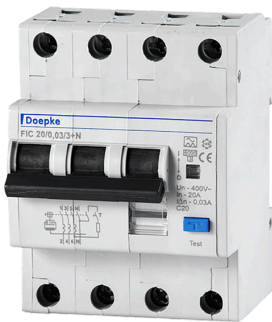
imagen del producto simbólico