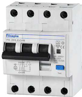
imagen del producto simbólico