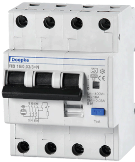
imagen del producto simbólica