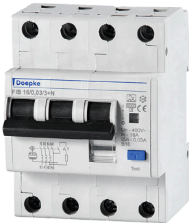
imagen del producto simbólica