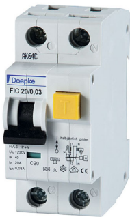
imagen del producto simbólico