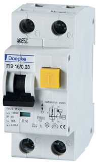
imagen del producto simbólico