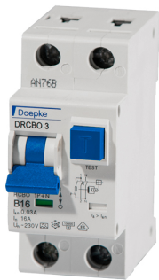
imagen del producto simbólica