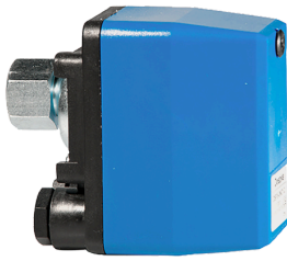
imagen del producto simbólico