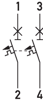
Anschlussschema DLS 6i, Z-Charakteristik, zweipolig, 10kA