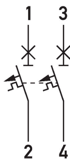
Esquema de conexiones DLS 6i, característica K, dos polos, 10kA