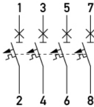
Esquema de conexiones