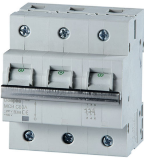
imagen del producto simbólico