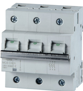
imagen del producto simbólico