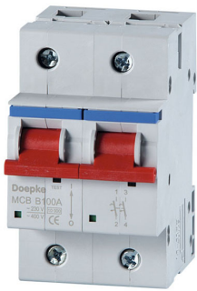
imagen del producto simbólico