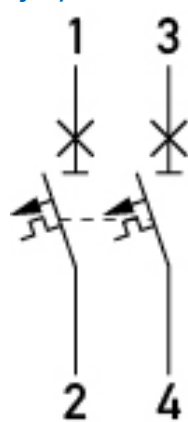
Esquema de conexiones