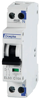
imagen del producto simbólica