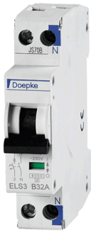
imagen del producto simbólica