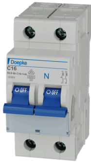
imagen del producto simbólica