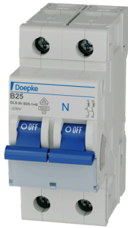
imagen del producto simbólica