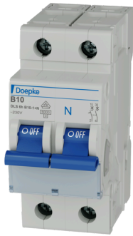
imagen del producto simbólica