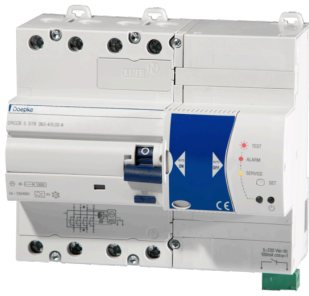
imagen del producto simbólico