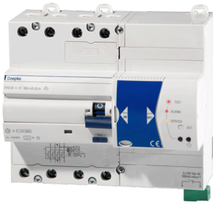
imagen del producto simbólico