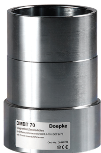
imagen del producto simbólico