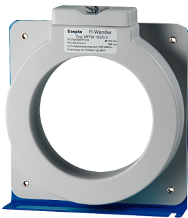
imagen del producto simbólico